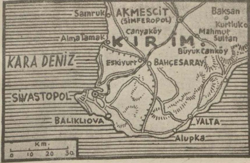
Sivastopol harb sahasını gösterir harita

Londra, 18 (A.A.) — Büyük Britanyada sinir sarsıntılarını tedavi için bir ilaç bulunmuştur. Çünkü bombardımanlar çok vahim asabi sarsıntılara sebebiyet vermektedir. Bu ilaç, hafif bir uyuturucu madde olup damanlara zerkeşilmektedir. Alimler, yaptıkları tecrübelerde tam muvaffakiyetler elde etmişlerdir.