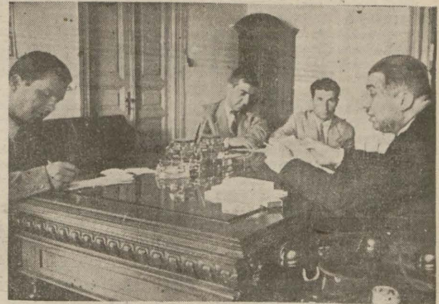
İnhisarlar Vekili gazetecilerle konuşurken

Dün Ankaraya dönen vekil, bira ve bulunmayan inhisarlar maddeleri, beyiye meselesi etrafında izahat verdi